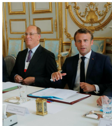
Larry Fink (BlackRock) et Emmanuel Macron à l'Élysée en juillet 2019

la France et de l'Europe ». Macron « bluffe l'homme le plus puissant de Wall Street », écrivra quelques semaines plus tard Challenges .