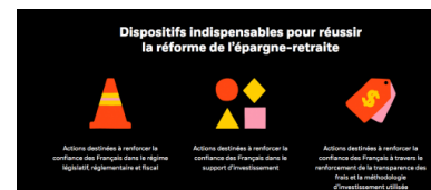
Les recommandations de BlackRock en images.

C'est cette gestion risquée de l'épargne que le gouvernement français accepte de soutenir dans sa promotion de la capitalisation. Officiellement, cela est censé aider le développement de l'épargne productive et le financement des PME. Mais les demandes de BlackRock au gouvernement vont tout à fait dans un sens opposé. Les produits d'épargne retraite, promus dans le cadre de la loi Pacte, doivent s'inscrire, recommande le gestionnaire, dans le cadre de la directive Juncker sur l'épargne paneuropéenne. Dans ce cadre, « la liste des investissements éligibles aux dispositifs d'épargne salariale gagnera à être étendue aux SICAV de droit étranger. [...] Un grand nombre de gestionnaires d'actifs ont des gammes de fonds domiciliées au Luxembourg ou en Irlande, qui sont aujourd'hui exclues de cette offre. » Deux pays à la fiscalité "compréhensive". En d'autres termes, il faut faciliter l'évasion fiscale et la fuite des capitaux. Sans que cela fasse frémir un seul responsable.