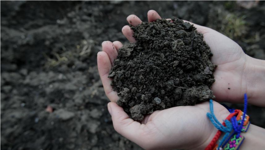
L'équipe de «Vert de rage» a fait analyser des échantillons de sols prélevés à Évin-Malmaison.

(/1170356/article/2022-04-23/pollution-de-metaleurop-evin-malmaison-des-donnees-inquietantes-presentees)